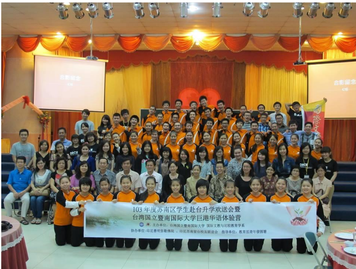
溫馨惜別晚會後合影（巨港開心學校）