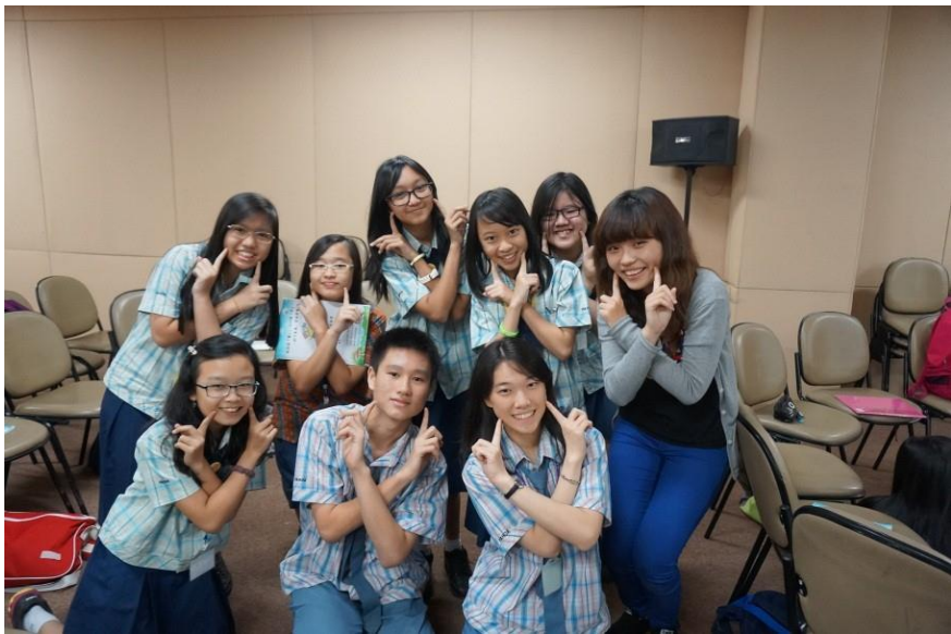
學生於課程中表演印尼肢體的特別含意，圖為學生展示可愛的動作

(1) 本系於6月15日至6月30日辦理「躍向國『暨』，心心相『印』-印尼雅加達華語體驗營」，由洪雯柔副教授及羅雅惠助理教授帶領8位同學於雅加達八華中學及巨港開心學校進行華語教學，此國際志工團隊活動藉由志願服務與學習，體會人道關懷、發揚人性美德，並透過有趣的華語教學提升學生學習華語的動機，對於推廣臺灣文化和高等教育有潛移默化的效果。